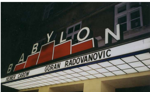
Goran - Babylon

„Nikada nisam pravio umetničke ni političke kompromise. Ne želim da po svaku cenu igram prema pravilima fondova i političke podobnosti.”