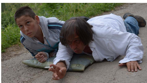
Na snimanju Enklave

sa mojom autorskom vizijom. Ulazite u koprodukcione odnose sa bogatijim zemljama čiji su budžeti mnogo veći pa gubite status glavnog producenta i dobijate saradnike koji su na nižem nivou (u estetskom smislu) nego što želite.