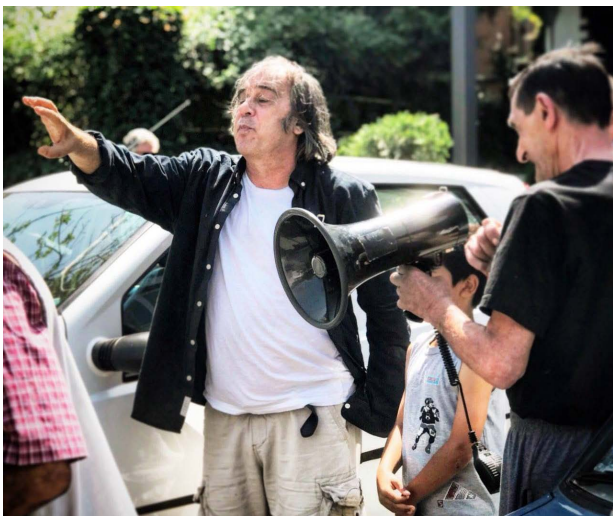
Na snimanju filma Slučaj Makavejev

U filmu glavnu ulogu ima skulptura Petra Lubarde koju je izradio veliki srpski vajar Marko Crnobrnja, Anica Dobra