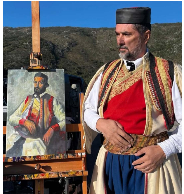
Lubarda, Na kuću ti gavran pao

Svestan sam tih problema, ali sam istovremeno i jedan od retkih srpskih autora koji nikada nije snimio komercijalni film niti reklamu. Živim isključivo od autorskog rada