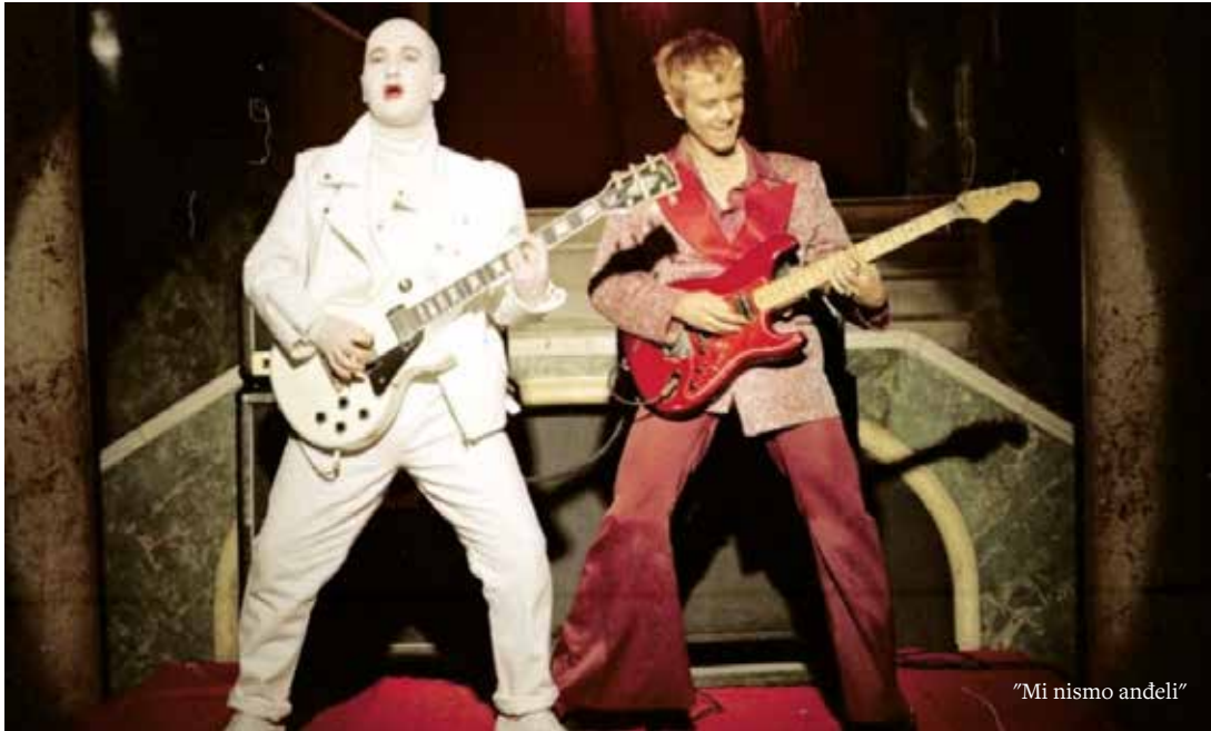
"Mi nismo anđeli"

Za deset godina trajanja UFUS AFA se stalno razvija i unapređuje, dajući pozitivan primer.